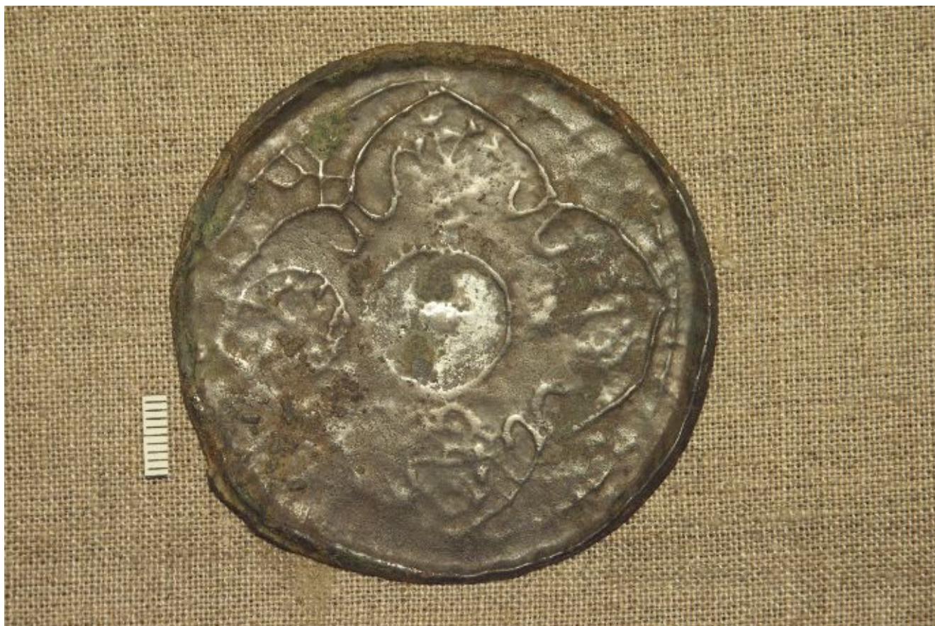
Рис. 4. Материалы Старомайнского археологического комплекса. Изделия из цветных металлов. 1-зеркало. 1- Старая Майна II.